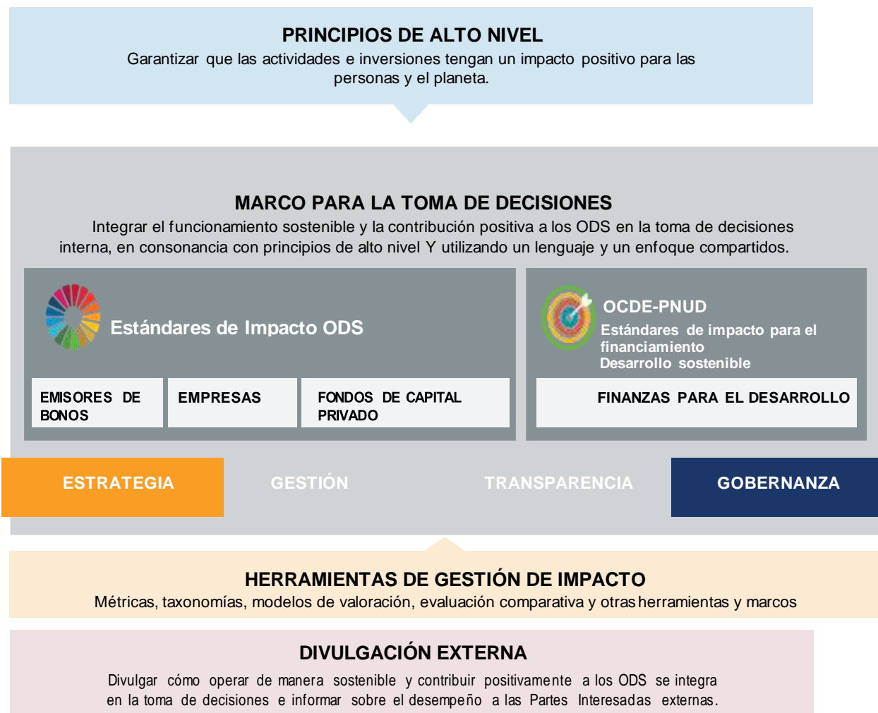
Figura 2: Cómo los Estándares trabajan con otros principios, marcos y herramientas